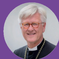
Heinrich Bedford-Strohm, Landesbischof i. R.

20. Februar 2025 um 19:30 Uhr im Antoniersaal Memmingen